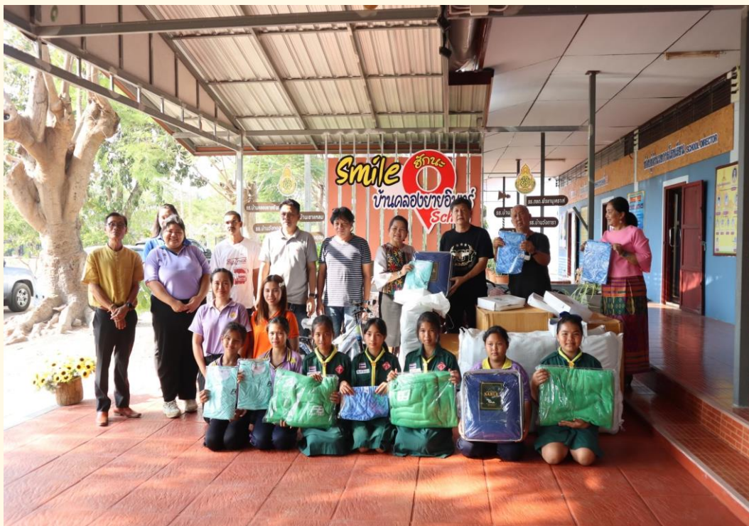
การสนับสนุนของรางวัล