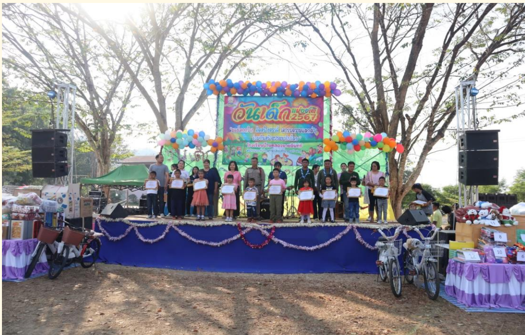
กิจกรรมวันเด็ก