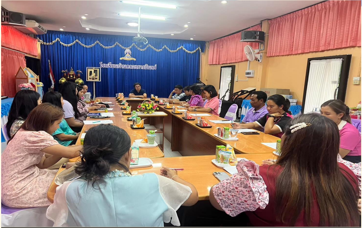
ประชุม ปรึกษา/หารือ คณะกรรมการสถานศึกษาขั้นพื้นฐาน