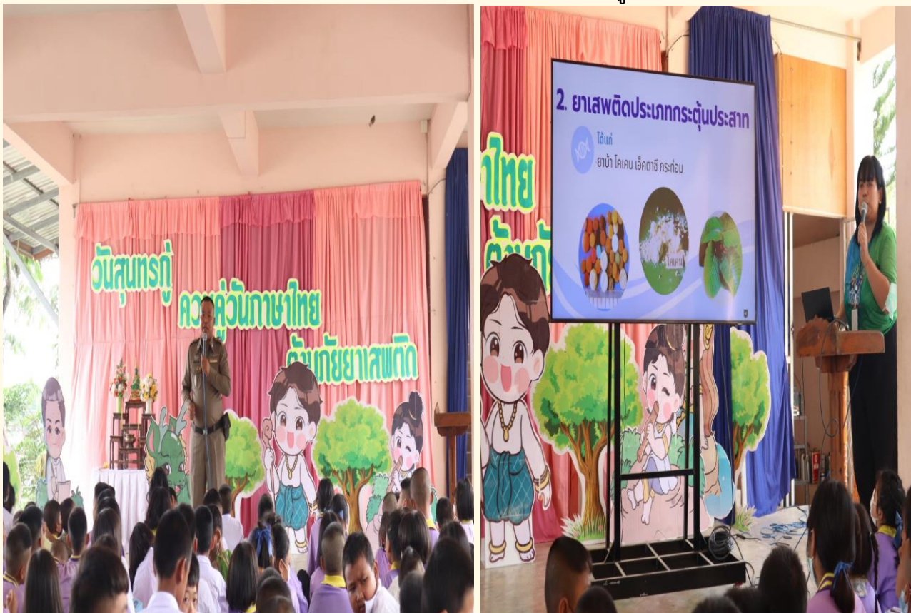
การเปิดโอกาสให้หน่วยงานภายนอกเข้ามีส่วนร่วมกิจกรรมให้ความรู้กับนักเรียนอยู่เสมอ