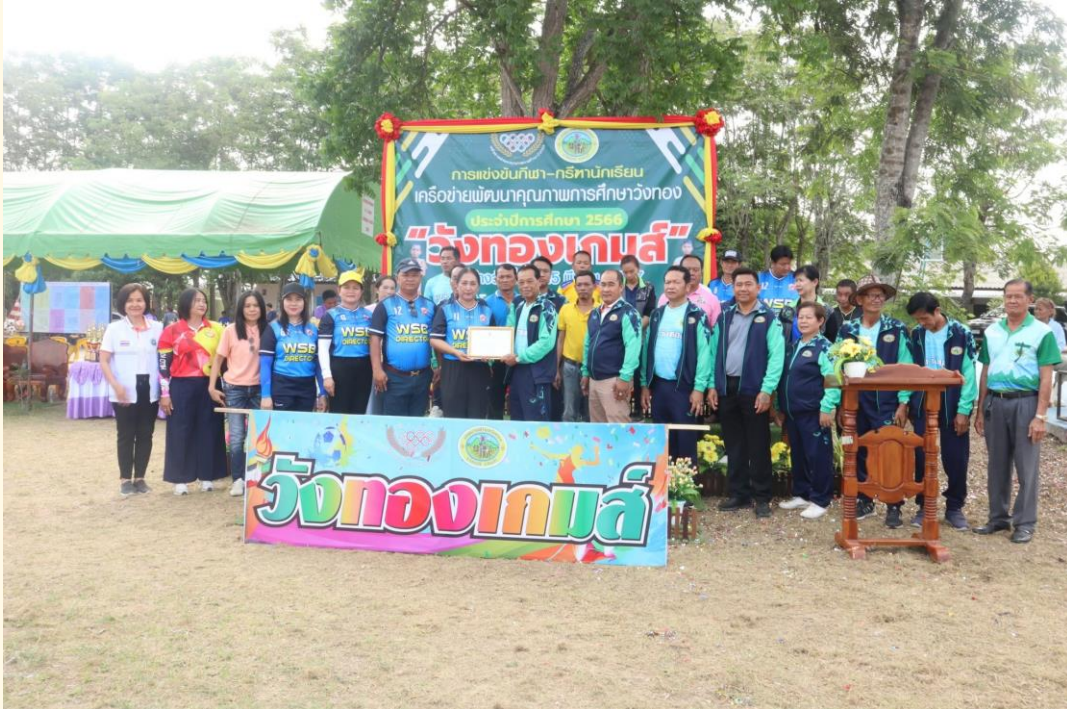
กิจกรรมการแข่งขันกีฬาโรงเรียน

เปิดให้ ชุมชน หน่วยงานต่างๆ เข้ามีส่วนร่วมในการจัดกิจกรรมภายในโรงเรียน เช่น การจัดกิจกรรมวันเด็ก การจัดกิจกรรมกีฬาภายใน กีฬากลุ่มเครือข่าย และการให้หน่วยงานภายนอกมีส่วนร่วม สนับสนุน ดูแล นักเรียน