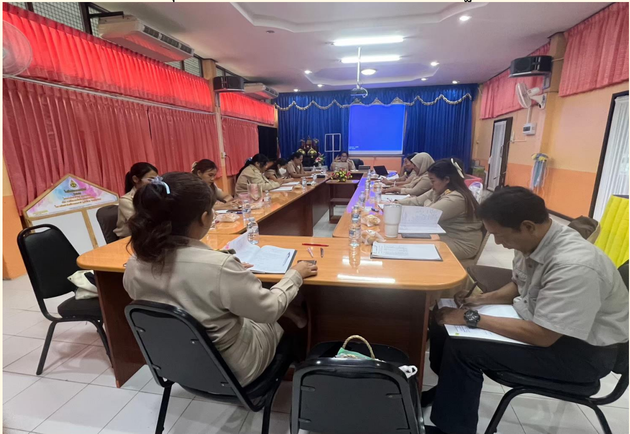
ประชุมปรึกษา/หารือข้าราชการครูและบุคลากรทางการศึกษา