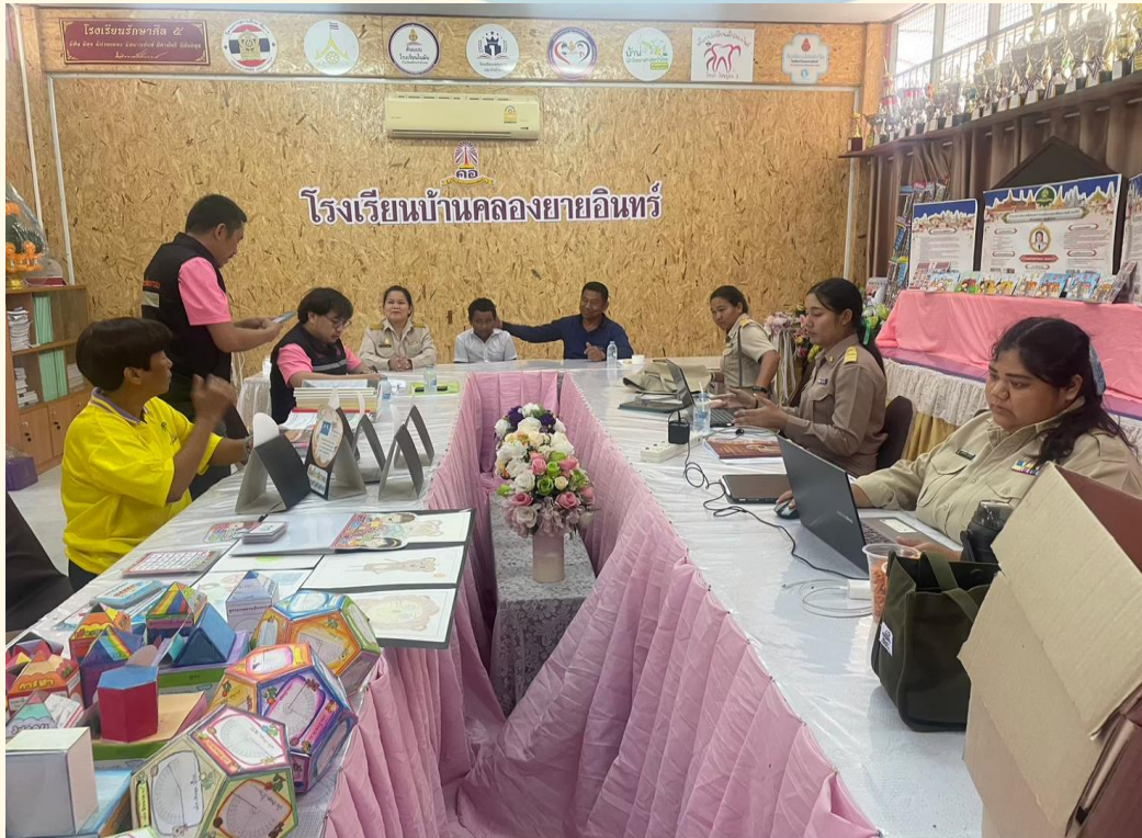
การเปิดโอกาสให้หน่วยงานภายนอกเข้ามีส่วนร่วมดูแลนักเรียน