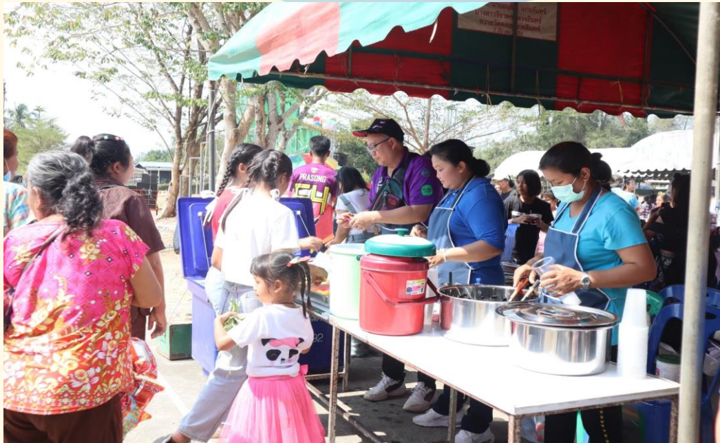
กิจกรรมวันเด็ก